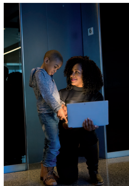
La compañía y supervisión de padres y adultos es vital para la seguridad de los niños en internet.