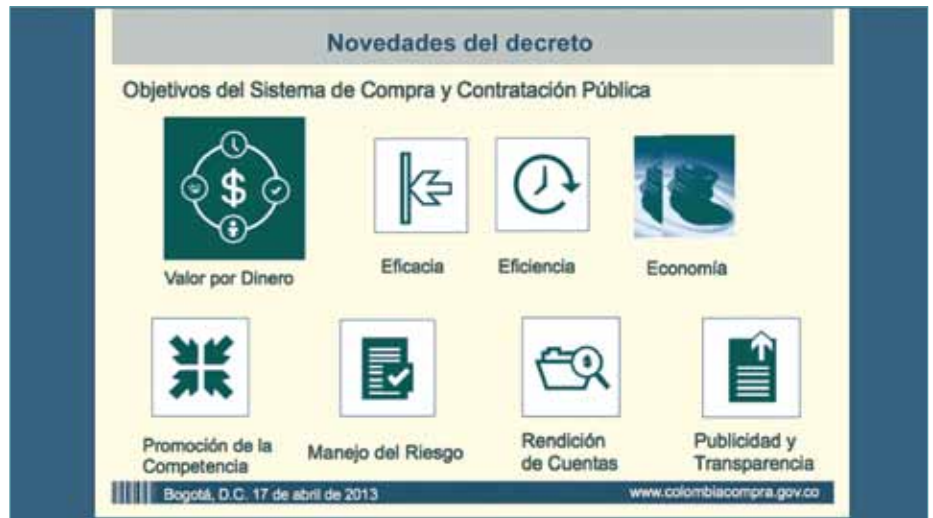
Con esta diapositiva la directora de Colombia Compra Eficiente explicó los objetivos del sistema de contratación pública.

“ El presupuesto nacional para el 2013 es de 185 billones de pesos, de los cuales 68,4 se ejecutan a través de compras y contratos. De ellos, 1,4 billones se invierten en el sector TI”.