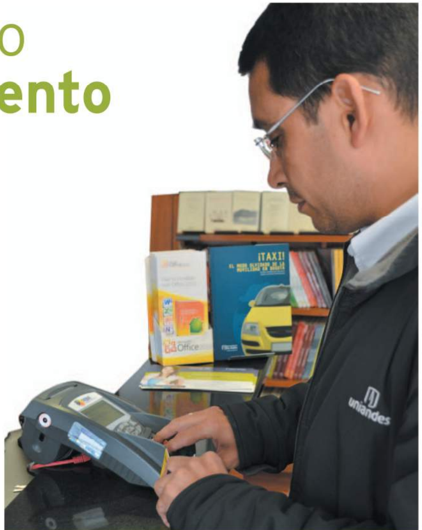
La cantidad de datáfonos en Colombia es baja: 150.000 en todo el país y muchos de ellos se concentran en las grandes ciudades. Masificar la tecnología ayudará a fortalecer el comercio electrónico.

Los pagos electrónicos son seguros si los usuarios tomamos las medidas adecuadas; algunas de ellas son: