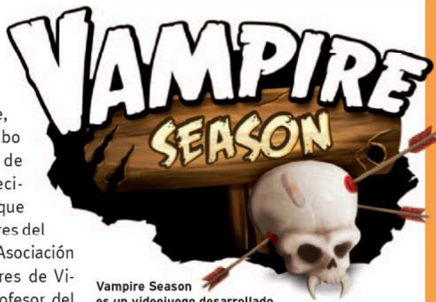
Vampire Season es un videojuego desarrollado por colombianos para el mercado internacional.

Veinte días más tarde se convocó al 4º Foro ISIS “Integración en desarrollo de videojuegos”, que tuvo entre sus conferencistas a Elliot Solomon, vicepresidente de Desarrollo de Negocios en Juegos para las Américas de Unity 3D. Los invitados analizaron el mercado para diferentes plataformas, sobre todo móviles, y las posibilidades que les ofrecen a los creadores de videojuegos plataformas de creación y desarrollo como Unity.