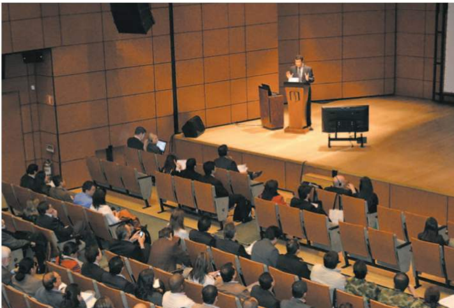
Los Foros ISIS son un espacio propicio para el debate y presentación de ideas y experiencias que aún no hacen parte de un conocimiento formalizado.

La arquitectura de TI está a la orden del día “pues todo el tiempo los sistemas se vuelven más complejos. La gente se dio cuenta del desorden y de la dificultad con que opera en términos de TI”. Por eso este perfil profesional es uno de los mejor pagados en el mundo, entre otras cosas porque requiere habilidades difíciles de encontrar: mucha experiencia para moverse en las organizaciones, alta capacidad de abstracción y de comunicación y una visión multidimensional tanto de los problemas como de las soluciones. Por eso, las arquitecturas de TI son una disciplina imprescindible para las empresas que quieren ser competitivas. ■